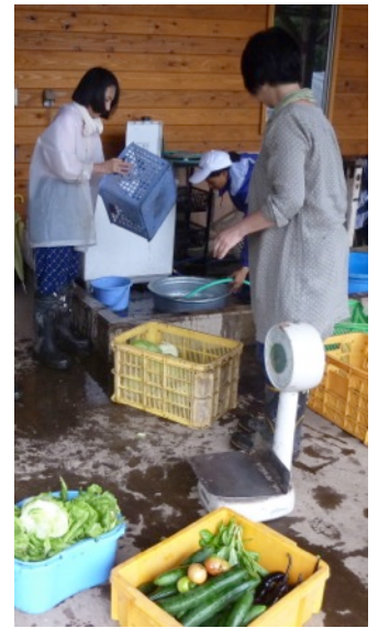
収穫した野菜を洗浄中

帰った自国で大型農機具が手に入らない場合を考えローテクノロジーに徹し、持続可能な農業を実現させるための有機農法を工夫しながら学ぶアジア学院のプログラムは、現実的で実践的です。かくも有意な民際支援があるということを目の当たりにして、私たちは感銘を受けました。そして、研修を通じて「母校」を共有した今、インドやフィリピンの支援先との距離も縮まったような気がしています。