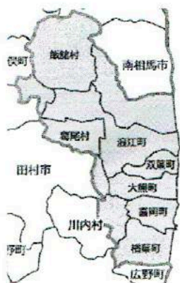
除染特別地域

製作・監督：河合弘之 構成・監修：海渡雄一 音楽：新垣隆 制作協力：木村結 脚本・編集・監督補：拝身風太郎 2015年|日本|ドキュメンタリー|カラー|ステレオ|ビスタ|138分|制作・配給：Kプロジェクト|©Kプロジェクト nihontogenpatu.com