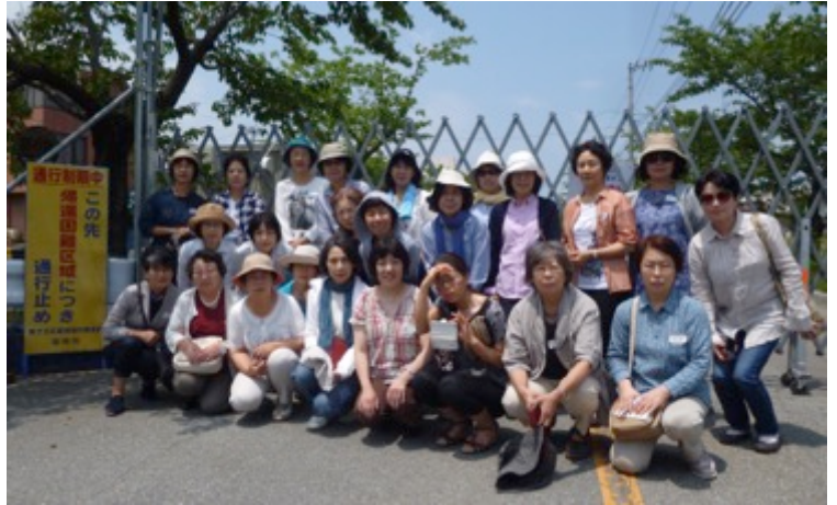
富岡町夜ノ森 帰宅困難区域ゲート前にて

復興事業の背後にある経済、被災者が受けた四重五重の苦しみ、事故にかかわる日本の報道のあり方、被災者目線に立つとはどういうことか。考えなければならないことをたくさん受け取って帰ってきました。