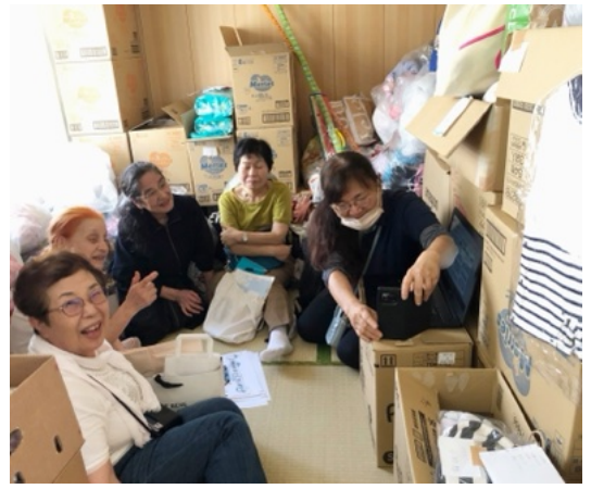
おもむつの箱が積まれた「つむぎ」の部屋で