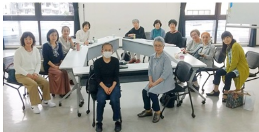
今年度もよろしくお願ひいたします (運営委員)

https://we21kk.org/ https://www.facebook.com/we21kouhoku/ https://we21kk.hatenablog.com